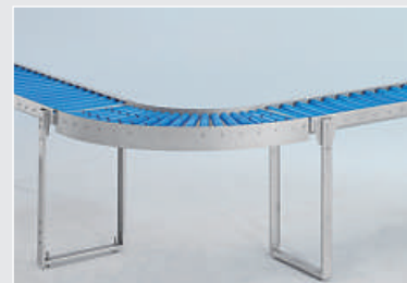
Curva de superficie de rodadura 90°