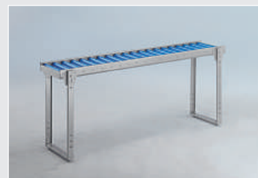
Superficie de rodadura