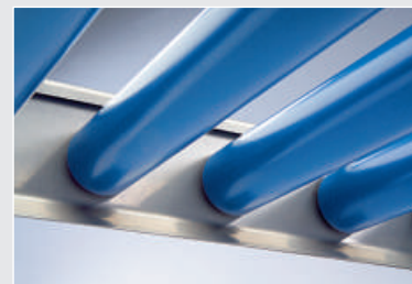
No es posible ningún sedimento de suciedad

Diríjase a nosotros. Nosotros planificaremos para usted el flujo de mercancía.