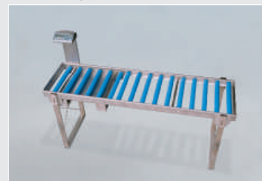
Báscula de superficie de rodadura