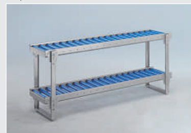
Superficie de rodadura dual en dos niveles